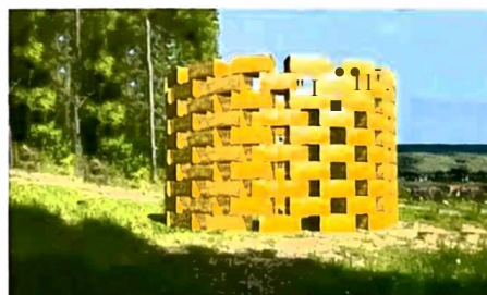
Eloge des dessous de Nicolas Triboulot CHAVOT-COURCOURT

Point de vue de Bouzy, « plage » de Bisseuil, Mont Gruguet à Mareuil-sur-Ay, Côte aux Enfants de Bollinger à Ay, Epernay-Bernon, Maison Gosset à Epernay, Pierry, Moussy, Vinay, Brigny-Vaudancourt, Chavot-Courcourt. Plus d'informations sur www.vignart.fr