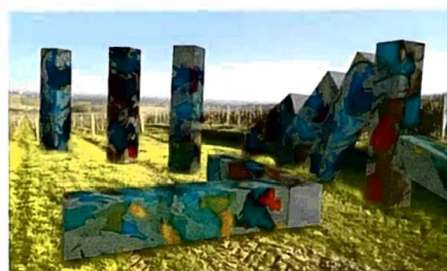
Dominoes de DEC MAREUIL-SUR-AV